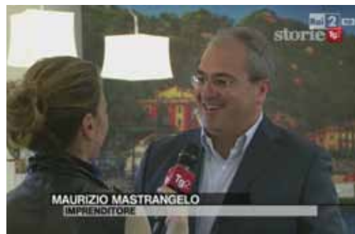
4 RAI 2 TG2 Storie Puntata del 28-06-2014