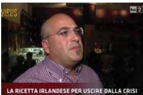
5 RAI 2 Virus Puntata del 17-01-2014