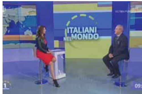
2 RAI 1 Uno Mattina Puntata del 17-12-2018