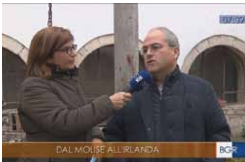
1 RAI 3 Molise Buongiorno Regione Puntata del 15-01-2020