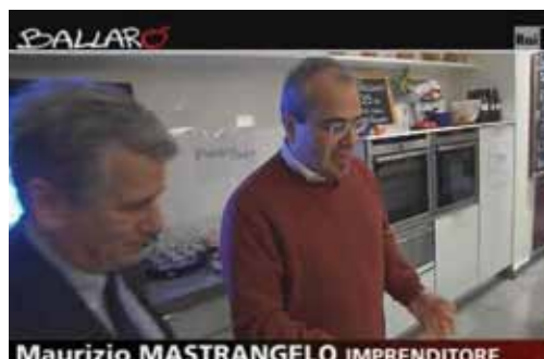
6 RAI 3 Ballarò Puntata del 15-01-2013