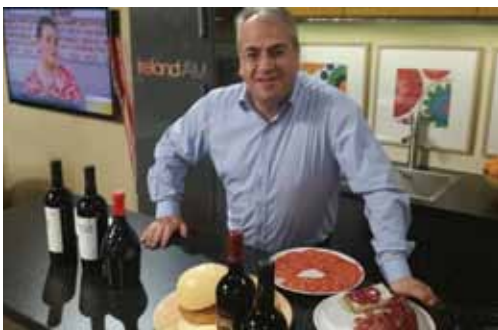
3 TV3 Ireland AM Puntata del 2015